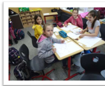
Methodentraining in Jg. 5

Grundschulen sowie mit Ihnen als Eltern bzw. Erziehungsberechtigte . Gemeinsame Dienstbesprechungen mit den Grundschulen, unser Methoden- und Medienkonzept , regelmäßige Elternabende, der Eltern-Schüler-Lehrer-Sprechtage für die fünften Klassen bereits im November sowie Elternsprechtage zeugen davon. Ferner