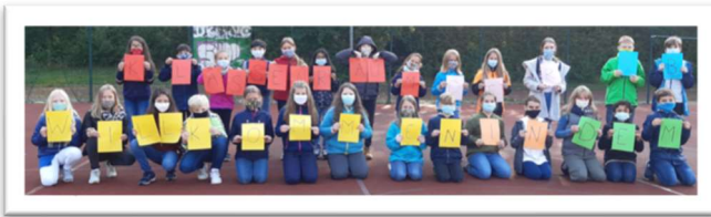
Herzlich willkommen am Humboldt-Gymnasium!

Neben einem Informationsabend für Eltern durch die Schulleitung und einem Schnuppertag für Schülerinnen und Schüler werden von der Schulgemeinschaft Schulführungen angeboten – zum gegenseitigen Kennenlernen und zum Erkunden unserer Schule. Falls gewünscht, werden im Vorfeld zusätzliche Beratungsgespräche angeboten.